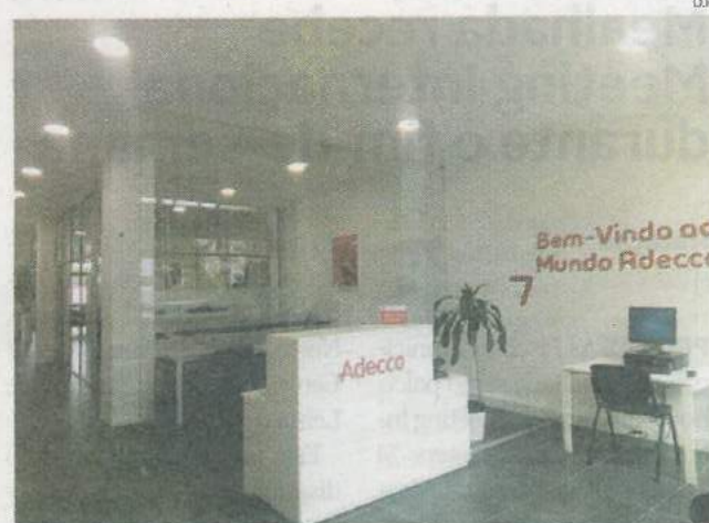
Delegação aveirense apresenta um novo "layout"

RENOVAÇÃO A Adecco Portugal, empresa de gestão de recursos humanos, anunciou a renovação da sua delegação de Aveiro, que apresenta um novo "layout".