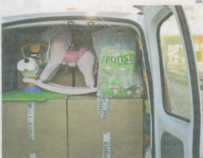
Campanha intitulou-se "Leve um Nicolau a Cada Criança"

Inicialmente, a campanha seria apenas destinada aos colaboradores da F. Fonseca mas rapidamente se foi alargando aos familiares dos colaboradores, amigos, clientes, fornecedores e parceiros. "E foi graças à generosidade de todos que, entre 1 e 15 de Dezembro, con-