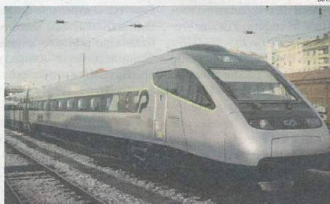
Campanha promocional vigora até ao próximo dia 15

DESCONTOS A CP - Comboios de Portugal disponibiliza, até ao próximo dia 15, uma tarifa promocional com descontos que podem atingir os 80 por cento, em viagens de longo curso. Neste período, viagens entre Lisboa e Porto podem ser adquiridas a partir de cinco euros nos comboios Intercidades, e a 6,5 euros em Alfa Pendular. Estes bilhetes podem ser comprados com a