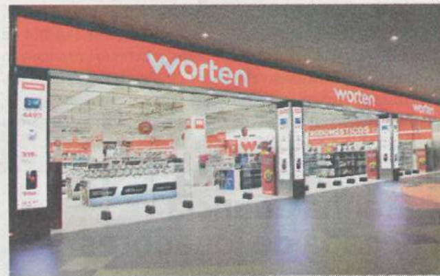
Negócio Fechado consiste num contrato de "renting"

NOVIDADE A Worten acaba de lançar o serviço Negócio Fechado, um contrato de "renting" que inclui, sem entrada inicial, um automóvel BMW Série 1 e um smartphone Samsung Galaxy S8, desde 349 euros/mês.